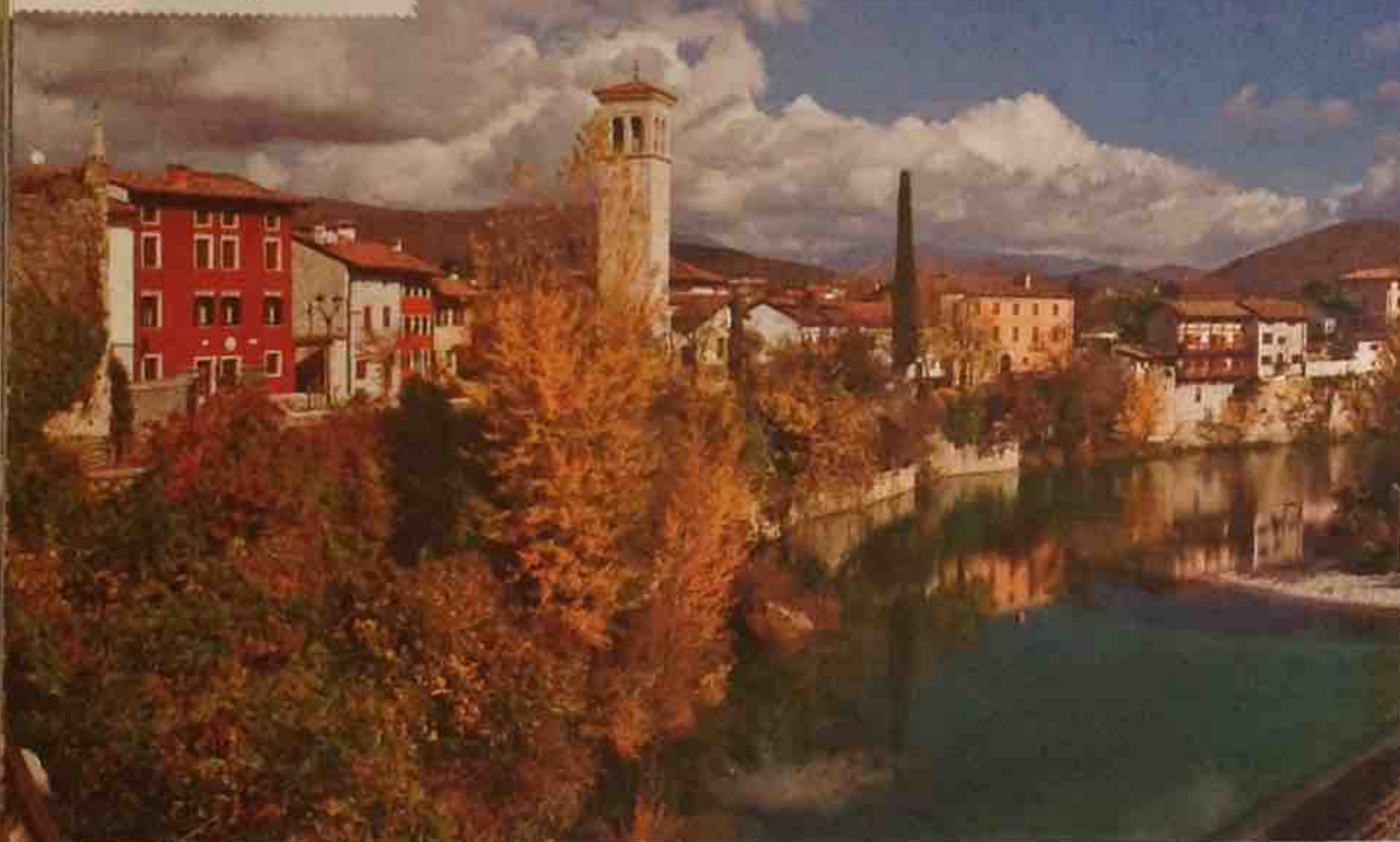
A sinistra: Cividale del Friuli, sulle rive del fiume Natisone. Sotto: una degustazione di prosciutto crudo San Daniele DOP.